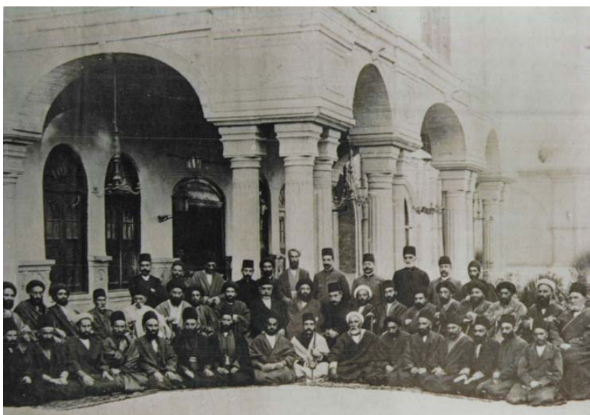
نمایندگان تهران در مجلس اول؛ شناسهٔ سند: ۹۹۸۰۰۰۱۲۰؛