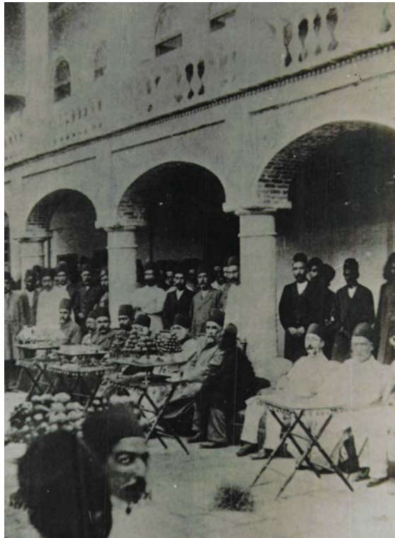
جشن گشایش نخستین مجلس شورای ملی؛ [مهر ۱۲۸۵ ش.]; شناسه سند: ۱-۱۲۰۰۱۲۰۰۹۹۸۰؛